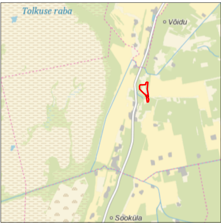
Kaardilehe nr 5314 (Häädemeeste)